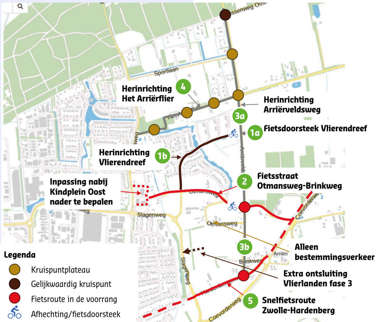
figuur 1. De voorkeursvariant

Het gemeentebestuur heeft daaruit één voorkeursvariant gekozen, die nu voor inspraak ter inzage ligt. Wie meer wil weten over de verschillende opties kan hier klikken om het gehele verkeersplan te lezen.